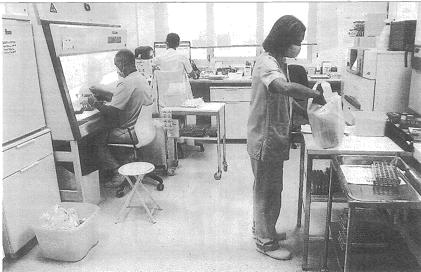
Personal de Osakidetza analizando ayer las muestras obtenidas.