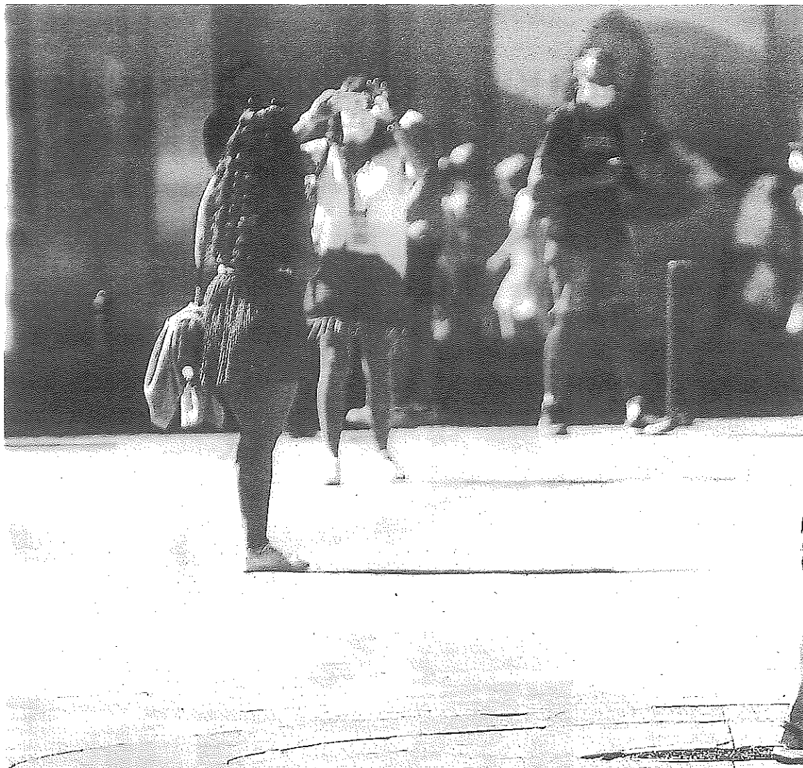
Una mujer camina ayer por el centro de la capital alavesa.

Los hospitales vascos cuentan ahora mismo con 205 personas ingresadas con covid-19, 26 de ellas en las últimas 24 horas.