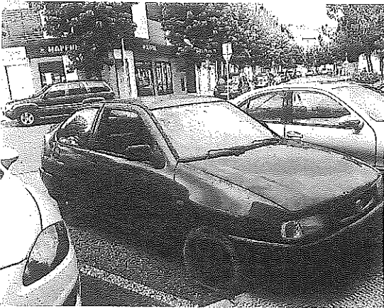
Vehículos abandonados en la calle.

Malpica y lo incendiaron, con tan mala fortuna que el varón sufrió quemaduras de las que tuvo que ser atendido en primera instancia en Miranda y posteriormente en Cruces, a donde fue trasladado. Mientras curaba sus heridas, la mujer acudió a la comisaría de policía de Logroño para interponer una denuncia por robo. El incendio fue detectado por una patrulla de la Ertzaintza y sofocado por los bomberos, pero la investigación dio como resultado la confirmación de la intencionalidad del incendio para poder cobrar el seguro y se tramitó como un delito de estafa.