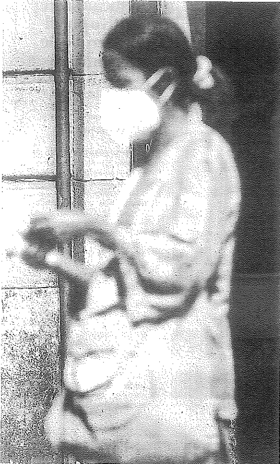
Varias personas pasean por Gasteiz este pasado sábado.