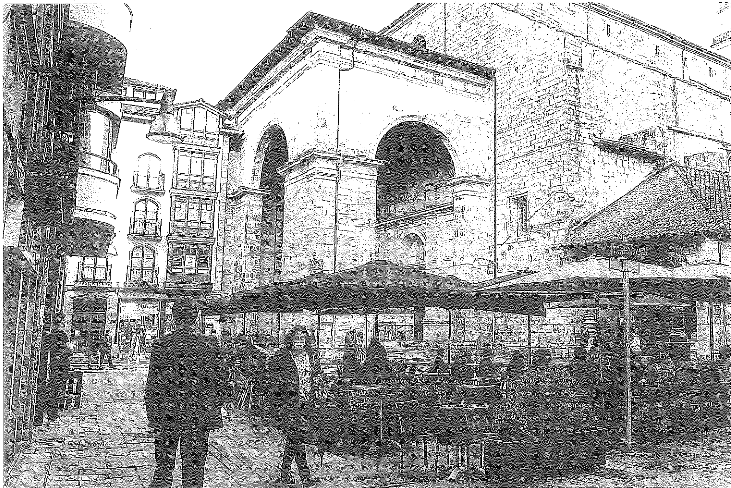
Durango es una de las localidades en las que se empezarán a aplicar medidas más restrictivas debido a que tiene una alta tasa acumulada de casos.