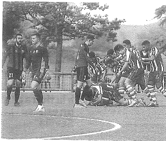
Buen estreno del 'Miniglorias'.

Goles Sobrido 1-0 (min. 35) y Abderrahmane 2-0 (min. 63) Árbitros Borja Martínez quien ha mostrado tarjetas amarillas a Jaouad Erraji (minuto 36), Andrei Lupu (minuto 41), Abderrahmane (minuto 86) por parte del Deportivo Alavés, y a Jaime Pol (minuto 75), Gorka Estrada (minuto 83), a Jon Vega (minuto 40 y 58) por parte del Arenas Club. Estadio Encuentro correspondiente a la 2ª jornada de la Segunda División B del subgrupo A del Grupo II en la Ciudad Deportiva José Luis Compañón (Ibaia).