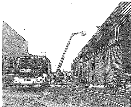
Un momento de la extinción del incendio de ayer.

accidente y lamentó, igualmente, la alarma desatada. Asimismo, agradeció la respuesta de los servicios de emergencias -sobre todo a los bomberos, pero sin olvidar al I12, ambulancias, Ertzaintza- porque con "una actuación rápida y un esfuerzo decidido" hicieron posible la atención al trabajador herido y la contención del incendio sin que se extendiera a los recintos anexos, controlando el siniestro en un plazo de tiempo breve. Asimismo, la dirección de Kupsa informó de que hoy se retomará la actividad en la empresa, reasignando al resto de plantas las fabricaciones previstas en la nave incendiada. Kupsa se encuentra en la carretera N-111, que en ese tramo funciona como circunvalación de Logroño y entrada a la localidad de Oion, lo que facilitó el acceso de los servicios de emergencia.