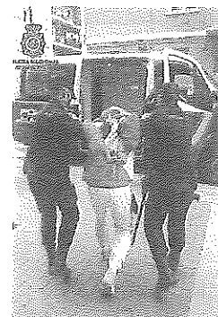
Momento de la detención. e.a.

La actividad en la empresa química KUPSA Coatings se restableció el pasado jueves, un día después del incendio, «reasignando al resto de plantas las fabricaciones previstas en la nave incendiada», informó la fábrica.