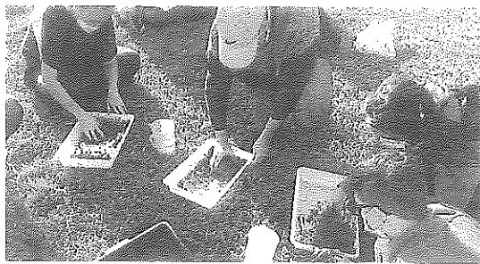
Actividades dentro de la nueva iniciativa puesta en marcha. e.a.

L.R. El Gobierno de La Rioja ha puesto en marcha la Red de Huertos Escolares Participativos Ecológicos, con el fin de impulsar estos espacios como una herramienta educativa.