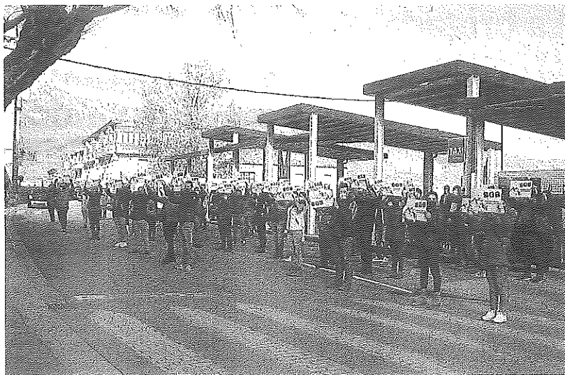
Manifestantes en Laguardia en la anterior concentración.

Por teléfono: 941 279 169 (de 9 a 17h) Por internet: oferplanlarioja.com Smartphone/tablet: A través de la APP Oferplan La Rioja