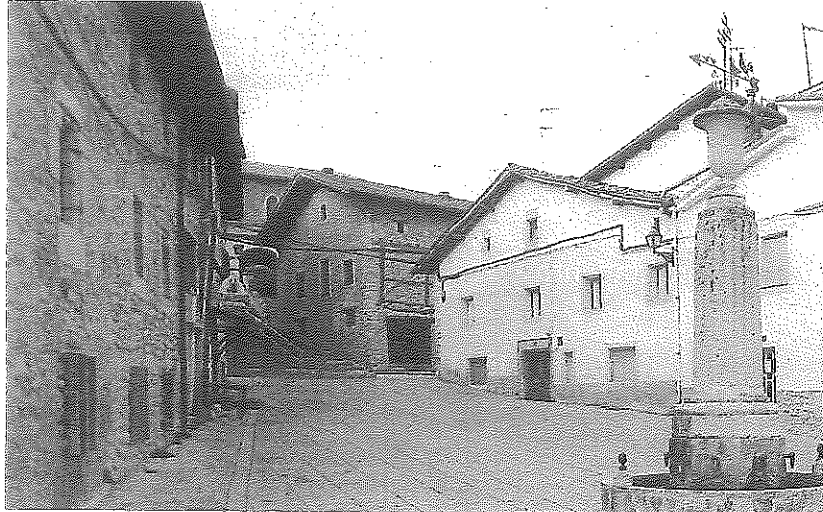
La plaza del pueblo de Lagrán, uno de los dos en Álava que no han sufrido el azote del covid-19.