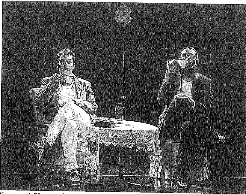
Una escena de 'Momentum'.

Pero eso ya llegará. Seguro. Lo inmediato es lo que sucederá la próxima semana. En lo que respecta a