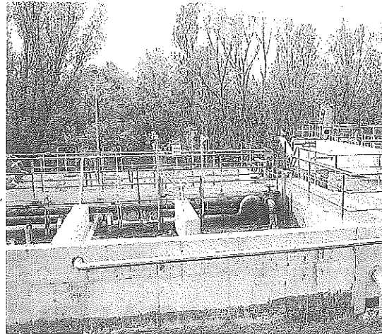
EDAR en un término de Lapuebla de Labarca.

SIETE AÑOS DE GESTIONES Hace ya siete años que el Congreso de los Diputados aprobó la ley 27/13 que ponía en marcha los mecanismos para que los consorcios actualizaran su forma jurídica como entes instrumentales, es decir, con personalidad jurídica pública diferenciada, patrimonio y tesorería propios,