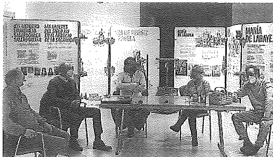
Presentación de la muestra en la Casa de los Maestros de Elciego.