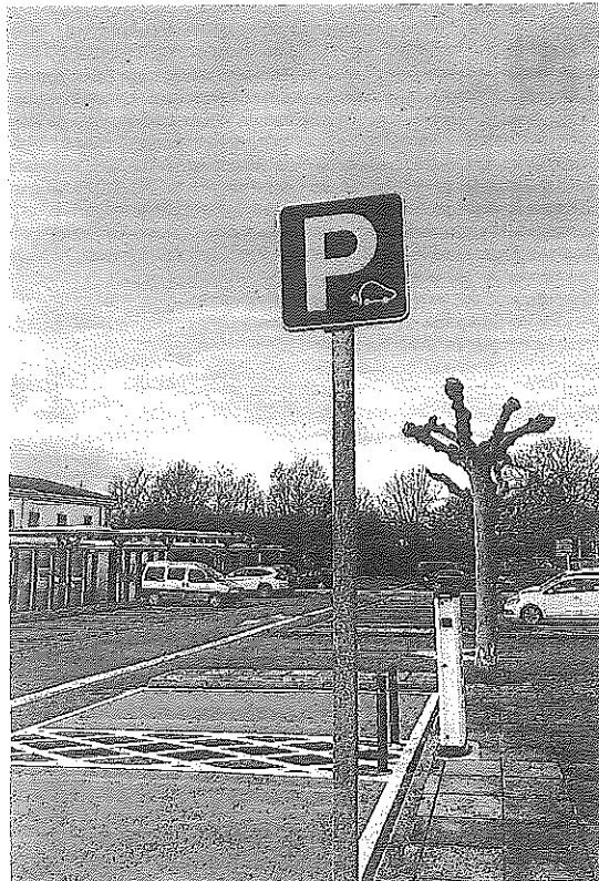
Punto de recarga.

El Ayuntamiento ha invertido más de 13.000 euros en la instalación