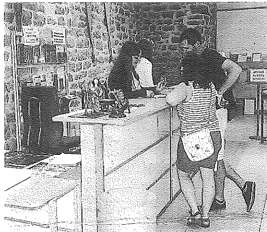
Visitantes en la Oficina de Turismo.

Los requisitos para la adquisición de los bonos requieren ser mayores de 18 años, personas empadronadas en Laguardia y que el titular acuda con su DNI a la Oficina de Turismo al realizar la compra del Bono. El horario de atención será de lunes a sábado, entre las 10.00 y las 14.00 horas, y de 17.00 a 19.00 horas, pudiendo adquirir un máximo de dos por persona, uno de cada tipo. Estos podrán ser utilizados en uno