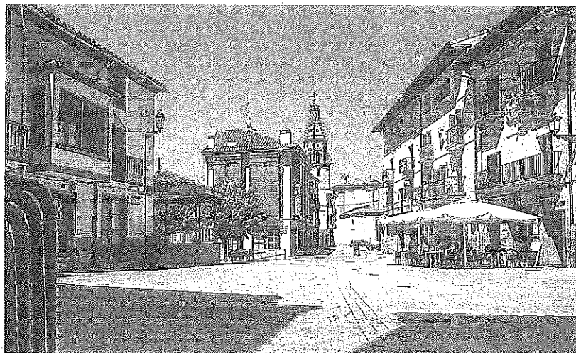
Plaza Mayor de Oyón, uno de los plazas protagonistas del nuevo plan de obras del Ayuntamiento.