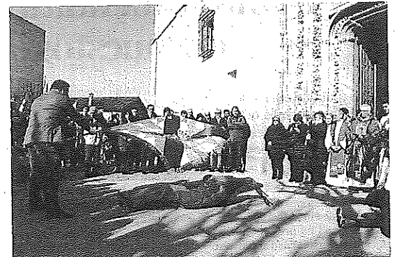
Momento de las fiestas de Oion.