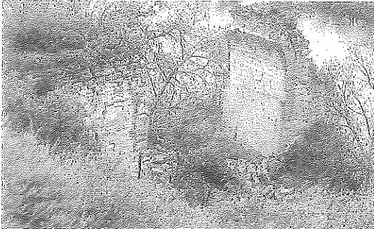
Estribo y pila del puente tras el derrumbe de casi todo el arco. s. TERCERO