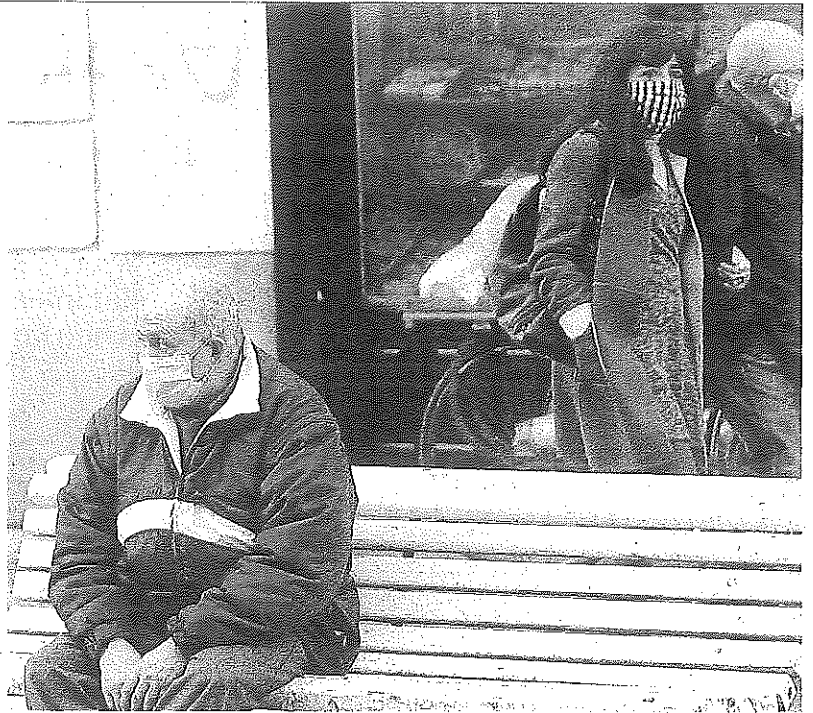
Un hombre, solo, sentado en un banco de Vitoria.

mos grandes superficies que tiran mucho, como el Decathlon o Brico Dépôt”.