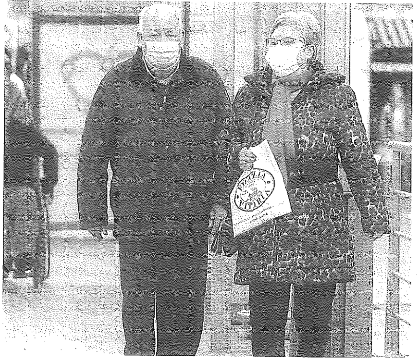
Dos personas caminan por la calle en Gasteiz.

Asimismo, consideran "muy importante" que el Departamento de Salud y Osakidetza, "emitan directrices claras de vacunación y que se sientan con los agentes sindicales para planificar de forma racional este proceso de vacunación".