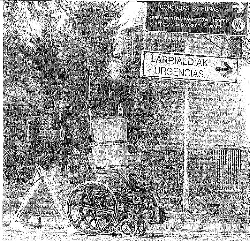
Dos trabajadores transportan material en los exteriores del HUA-Txagorritxu.

NÚMERO REPRODUCTIVO BÁSICO El indicador que mide la capacidad de infectar de una sola persona se acerca a 1, la barrera que nunca debe superar para dar la pandemia por controlada.