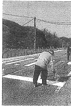
Pintando el paso de cebra.

Da respuesta a una vieja demanda de los vecinos en materia de movilidad y seguridad viaria