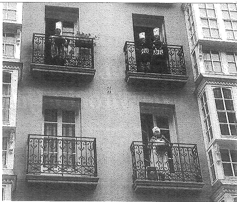
Gasteiz, en pleno confinamiento, honró a San Prudencio hace un año desde los balcones.

En cuanto a la incidencia de la situación epidemiológica en los centros escolares de Euskadi, Educación informa de que, por ahora, no hay ningún colegio con la actividad educativa presencial suspendida, aunque sí 77 aulas clausuradas en 49 centros educativos, que representan el 0,44% del total de clases. Recuerda el Gobierno Vasco que este curso, el sistema educativo vasco cuenta con un total de 17.554 aulas desde los 2 años hasta la educación no universitaria postobligatoria. ●