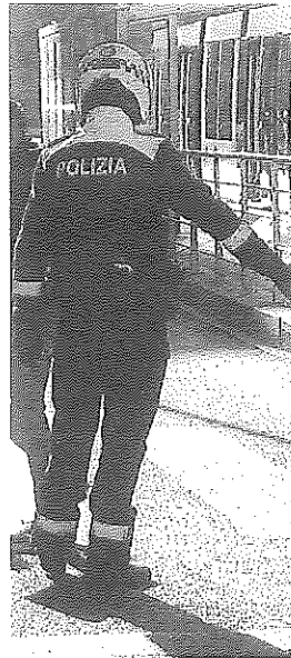
Policía Local de Vitoria.