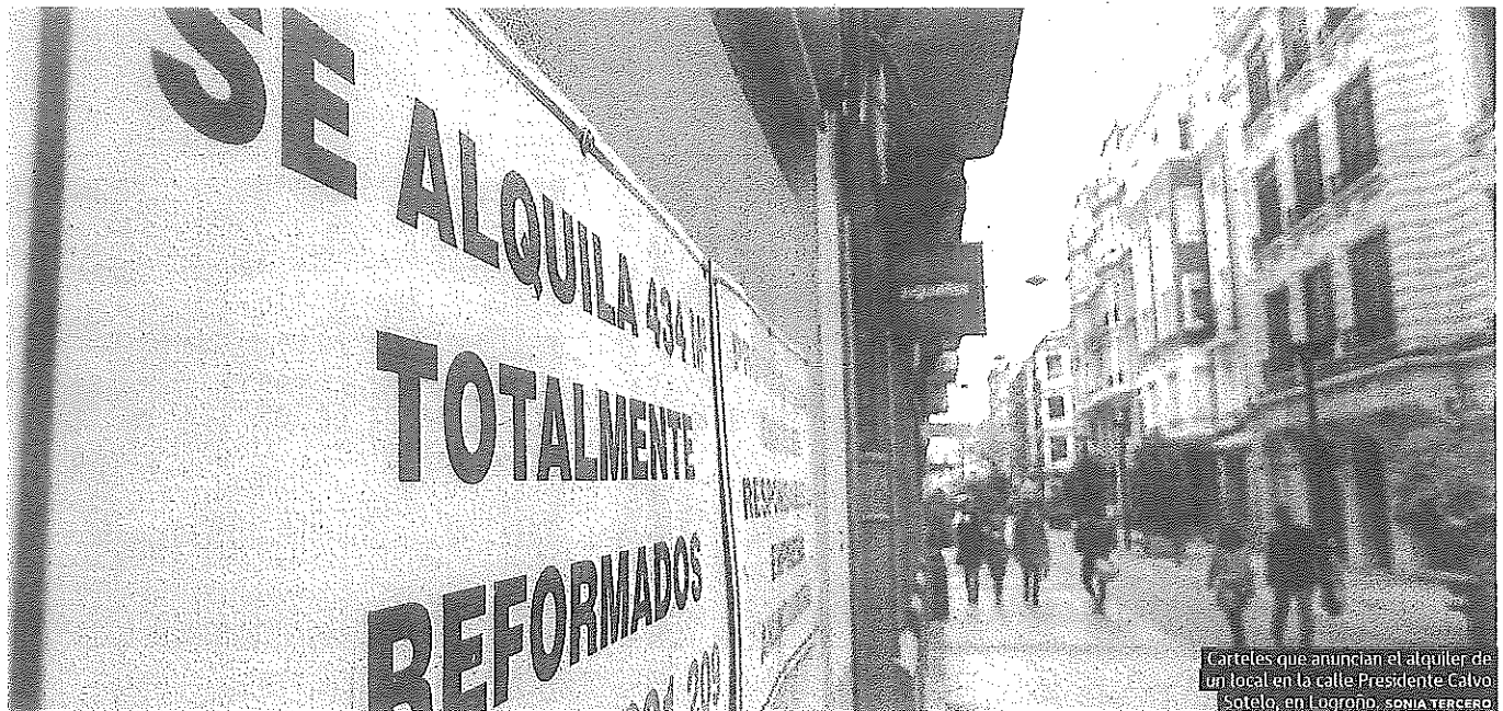
Carteles que anuncian el alquiler de un local en la calle Presidente Calvo Sotelo, en Logroño. SONIA TERCERO

La investigación ha permitido detener al menos a dos personas en una operación que continúa abierta P9