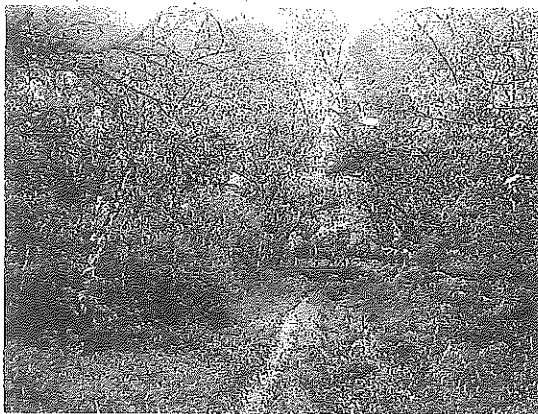
Ruta 'Bosques secretos' en Trespuentes.

Desde su inclusión en Wikiloc, se han registrado 10.020 visitas, siendo los 'Bosques secretos' la más descargada