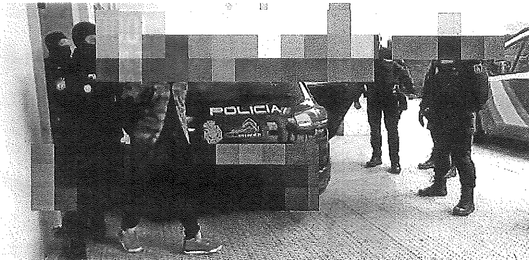
Imagen de la detención, en el barrio de Los Lirios de Logroño, de uno de los presuntos asesinos del joven vecino de Oion.

Los otros dos agresores mayores de edad son detenidos el sábado, uno en la calle y el otro en su casa. La Policía realiza