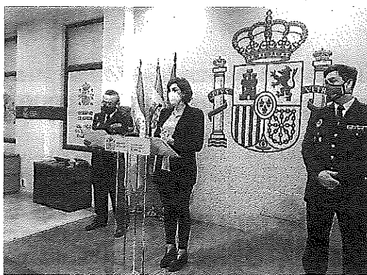
Los responsables policiales informaron ayer de las detenciones. s.x.

Las menores, hermanas de 14 y 16 años, residían en un piso tutelado y ahora están internas en un centro de reforma