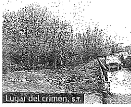
Lugar del crimen