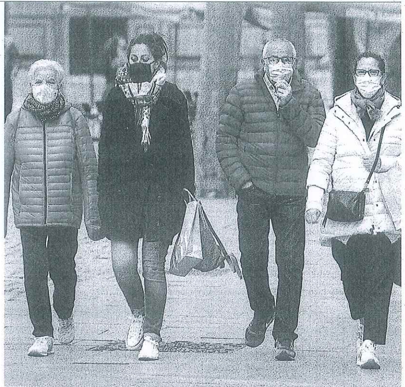
Varias personas protegidas con mascarillas pasean por el centro de Vitoria.

Números absolutos al margen, destaca la altísima letalidad que el virus ha tenido en tres pequeñas localidades de Rioja Alavesa. Samaniego, que ha sumado tres fallecimientos con apenas 30 positivos (10%), cuadruplica la media, mientras que Baños de Ebro —un deceso y letalidad del 8,3%— y Yécora —dos y 7,1%— la triplican. ●