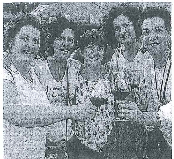
Edición anterior de la Fiesta de la Vendimia.

A pesar de esta decisión, no se renuncia a realizar actos adaptados a la situación sanitaria que nos toca vivir. Para ello se ha comenzado a preparar, entre otras actividades, visitas a bodegas y catas con un número reducido de visitantes que se repartirán por toda la comarca y se desarrollarán los dos primeros fines de semana de septiembre, incluyendo menús especiales en los restaurantes que se sumen a la iniciativa. A principios de verano se harán públicas estas propuestas. — Pablo José Pérez