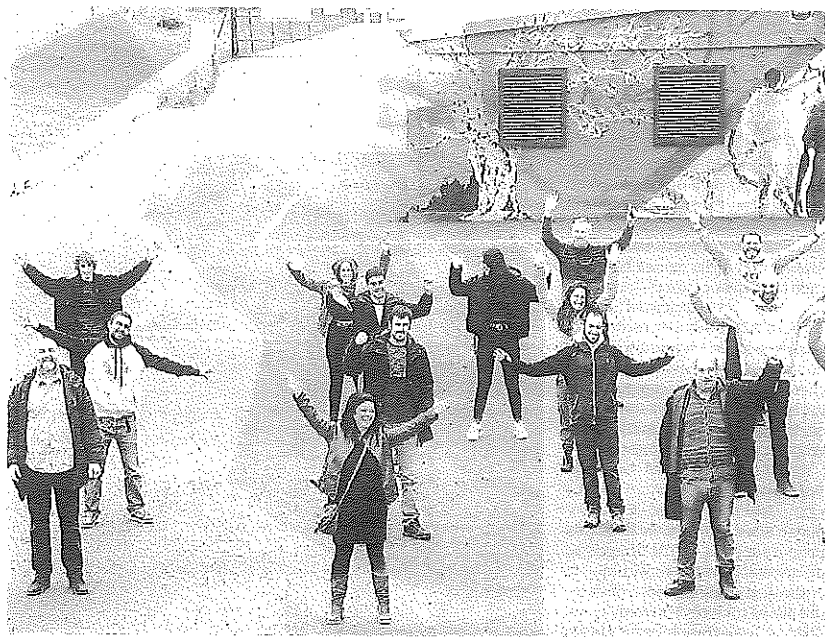
Parte de los participantes, en la presentación del campeonato.