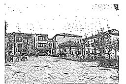
Plaza Mayor de Oion.

Según el TVCP, el Ayuntamiento ha cumplido razonablemente con la normativa legal que regula su actividad económico-financiera en el ejercicio 2019, si bien se han detectado salvedades puntuales en el área de Contratación (se ha superado la duración máxima de un contrato de servicio, y 4 suministros y servicios, tramitados como contratos menores, deberían haberse adjudicado por procedimiento abierto). - Pablo José Pérez