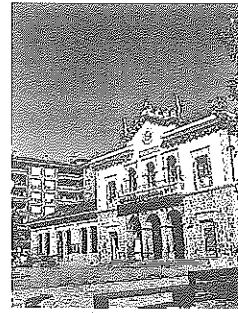
Fachada del Ayuntamiento de Amurrio.