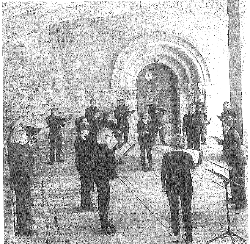
Una actuación de una coral en pandemia.

La protesta más inmediata será la que se producirá este domingo y aunque en principio la idea era unir a los coralistas en las capitales, Llodio será