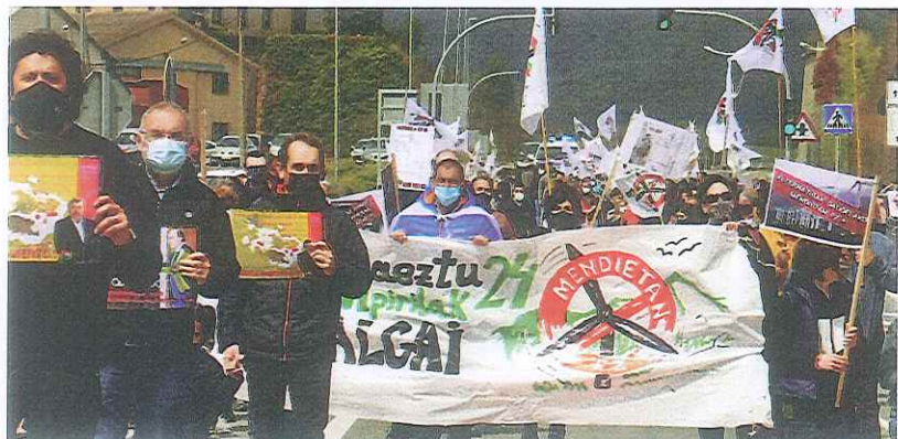
Apirilaren 24an, 600 pertsona bildu ziren Maeztun parke eolikoaren aurka. MENDIAK ASKE