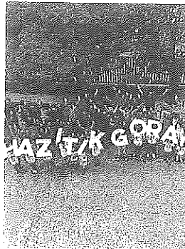
En el patio de Labastida.

Imaz recuerda que "desde el inicio de la pandemia la actitud de las familias y de la comunidad educativa de la Escuela Pública Vasca ha sido ejemplar. Por esa responsabilidad, no le vamos a dar el final deseado a este curso que ha sido tan difícil para los y las que formamos parte de la red educativa pública vasca". Sin embargo, "la semilla de la escuela