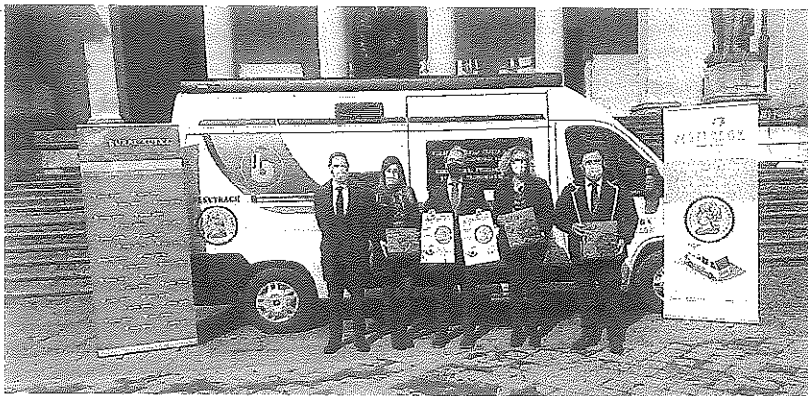
Presentación de la campaña 'Pesetrack' frente a la Diputación Foral de Álava en Vitoria. ARABADENDAK