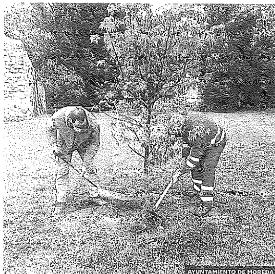
AYUNTAMIENTO DE MOREDA

El Ayuntamiento de Moreda de Álava ha participado en el proyecto #UnÁrbolPorEuropa promovido por la Oficina del Parlamento Europeo en España plantando un liquidámbar en el parque de Las Cuevas. Con este acto, el Consistorio de la localidad quiere mostrar su compromiso con el medio ambiente promoviendo la sostenibilidad y el cuidado de la naturaleza. Además, se pretende alcanzar los objetivos de desarrollo sostenible dentro del marco de la Agenda 2030. Este singular tipo de árbol, un liquidámbar de cuatro metros de porte, ha sido plantado cerca del Oasis de Mariposas de Moreda, otro de los elementos de educación ambiental promovido por la entidad.