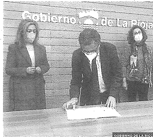
GOBIERNO DE LA RIOJA

«Queremos un Logroño libre, feliz, feminista y vivo». Este fue el clamor que se lanzó ayer en la Plaza del Ayuntamiento en una concentración convocada por el Consistorio para mostrar su rechazo por los asesinatos de seis mujeres y un menor en la última semana. El Ejecutivo riojano también firmó dos convenios, dotados con 70.000 euros, para mejorar la protección de las víctimas de violencia machista.