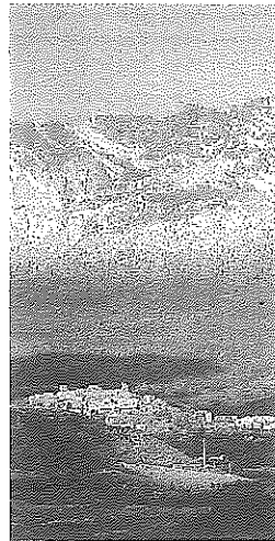
Panorámica de Laguardia.

362 BODEGAS Posteriormente intervino David Gutiérrez para comentar el estado del urbanismo en la comarca, destacando que, en lo referido a la estructura productiva y a su relación con el urbanismo, en Rioja Alavesa hay 362 bodegas, de las que más de 100 están en suelo no urbanizable y, de ellas, a partir de 2010 se han construido 10 bodegas nuevas en suelo no urbanizable y 5 en suelo urbano o urbanizable. De ese conglomerado forman