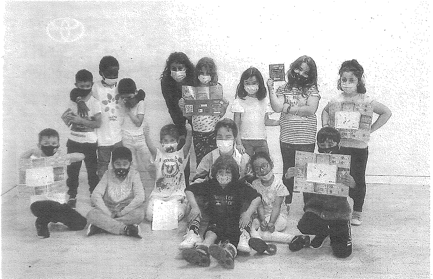
Jóvenes alumnos de primero de Primaria que han participado en la elaboración de la guía.