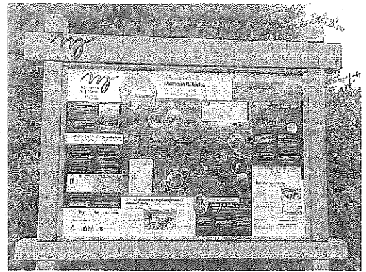
Panel explicativo sobre el itinerario.