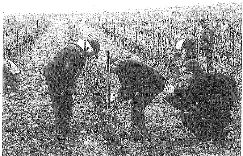
Participantes en el concurso de poda de viñedos entre vecinos de Elciego y Cussac Fort Médoc.

Las lluvias del jueves por la tarde fueron generales, pero con una fuerte intensidad entre las cuatro y media y cinco y media de la tarde, con aforos, en algunas localidades, de entre 40 y 50 litros por metro cuadrado en espacios de apenas media hora, especialmente entre los términos de Párganos, Navaridas, Lantziego, Assa, El Campillar, Moreda y Yécora, casi siguiendo el curso del río Ebro. La piedra que cayó destruyó numerosos brotes y las lluvias