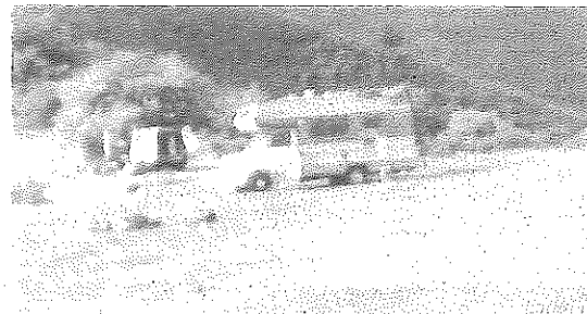
El Portilla vuelve a quedarse vacío tras la salida de la Familia Arcoiris. L.R.

estancia, la Guardia Civil visitó en varias ocasiones este asentamiento de la 'Familia Arcoiris' interponiendo hasta un total de 76 denuncias por acampar ilegalmente, por hacer fuego o por no respetar las medidas sanitarias para la prevención del virus. A pesar de todo esto, los veci-