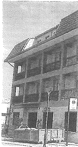
La Casa Sindical.

En él se encuentra actualmente la denominada Casa Sindical, pero dada la antigüedad de este edificio, se considera la necesidad de su completo derribo para reedificar en su lugar un edificio nuevo adaptado a las nuevas normativas de Edificación, Accesibilidad y Medio Ambiente. La superficie estimada para cubrir las necesidades del nuevo centro asistencial es de 840 metros