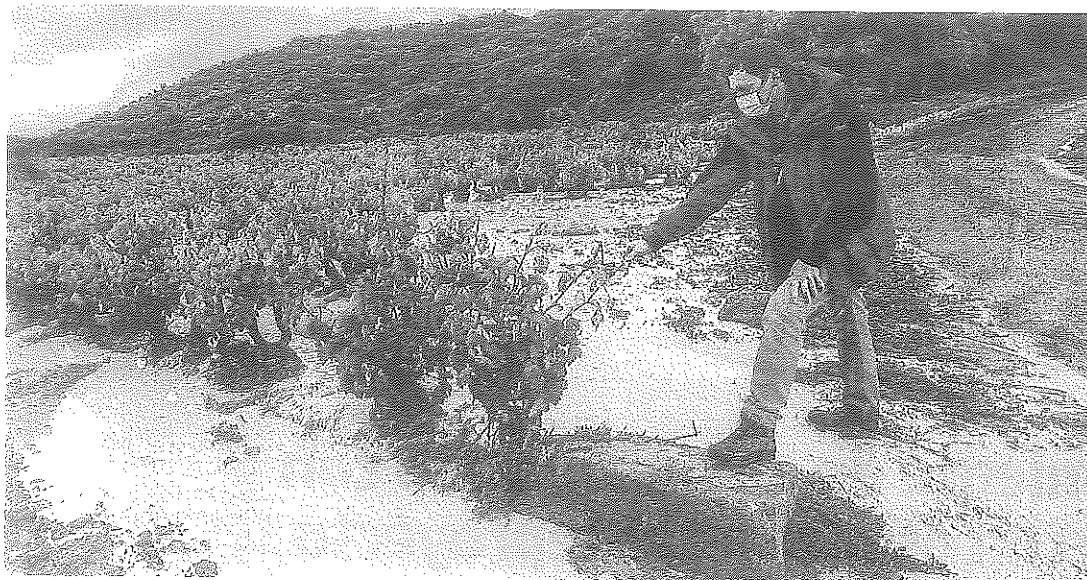
La tormenta de la semana pasada inundó numerosos viñedos, como los de la imagen en Assa (Lanciego). IEGOR AIZPURU