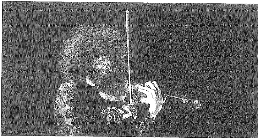
Ara Malikian en concierto.

En el caso de Malikian, su vuelta al pabellón se producirá a las 21.00 horas, "momento en el cual podremos disfrutar de uno de los shows más potentes de uno de los artistas internacionales más importantes del mundo", como recuerdan desde la promotora. "Desde los recintos más grandes y espectaculares de