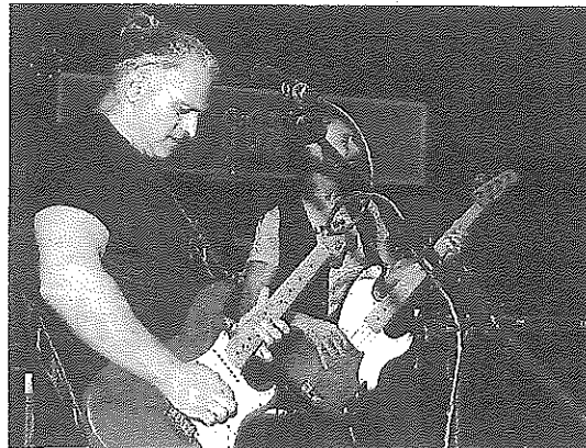
El grupo llodiano Cuchillo Manteca actuará en Aldai el 17 de julio. s. e.

El grupo local Cuchillo Manteca podrá volver también a los conciertos en directo poniendo el colofón a la programación de julio con una actuación el sábado 17 en la plaza Aldai a las ocho de la tarde. Antes de eso, el día 9 pasará por Llodio el grupo de teatro Hortzmuga y los boleros de Son de Indianos, el 10.