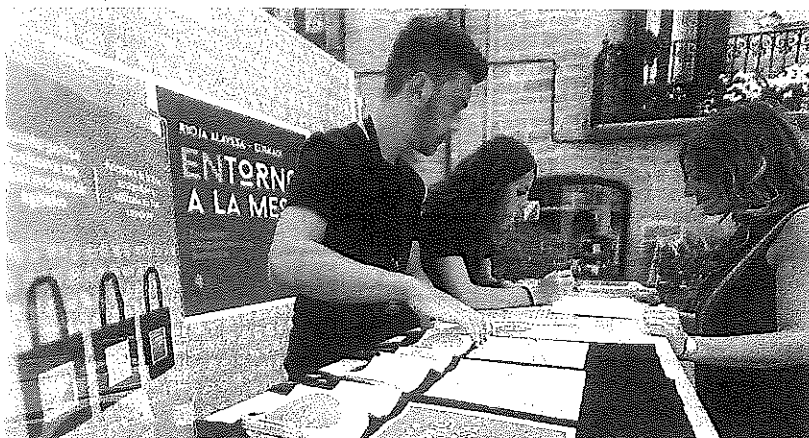
Una mujer solicita información en uno de los puestos del evento 'Entorno a la Mesa' de 2019, m. c.

La Mahai Experience, situada en la zona deportiva de Labastida, ofrecerá, en un único espacio, degustaciones de vinos y vermú de Rioja Alavesa maridados con diferentes pinchos. Además, habrá música en directo y coloquios de expertos del sector. Por último, para los amantes del deporte, 'Entorno a la Mesa' ha preparado una ruta de menos de tres horas que recorrerá los enclaves característicos de Labastida.