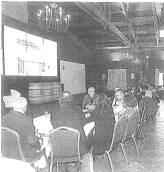
Foro de turismo enogastronómico celebrado en el Villa-Lucía. n.e.

ma edición entre los días 18 y 19 de noviembre. El foro se ha convertido en todo un éxito en el mundo de la enología y el turismo, tras haber reunido a lo largo de sus anteriores ediciones a los más reputados expertos en ambas materias. En esta edición, se abordará el enoturismo inclusivo, sostenible, con valores y que ponga en relieve el territorio.