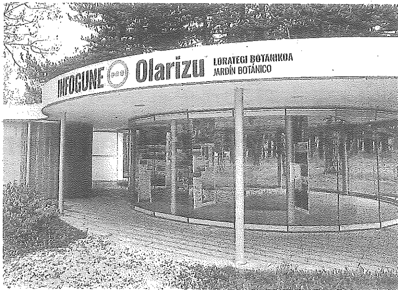
El punto de información, situado al final de la Avenida de Olárizu. ALEJANDRO ERNESTO

La firma deberá encargarse de prestar atención al público