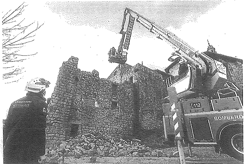
Los arquitectos evaluaron los daños ayudados por una grúa de los bomberos.

Rehabilitación, «cuanto antes» Los arquitectos de Patrimonio, ayudados de la grúa de los bomberos, visualizaron desde la altura los desperfectos, también en la parte intramuros. Tanto en Labraza como en el Ayuntamiento de