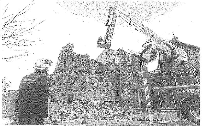
Los bomberos evalúan los daños tras el derrumbe de una parte de la muralla de Labraza. s.c.