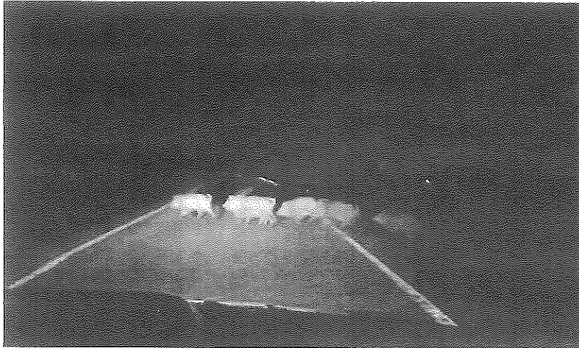
Un grupo de jabalíes atraviesa una carretera en la comarca de Montaña Alavesa.

El pasado 9 de noviembre las organizaciones agrarias COAG (en la que está integrada UAGA), Asaja y UPA presentaron ante la Audiencia Nacional un recurso contencioso-administrativo contra la orden del Ministerio de Transición Ecológica y Reto Demográfico, de 20 septiembre de 2021, que prohíbe cazar al lobo. Los